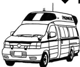
【資格・器材等の高度化された救急隊】