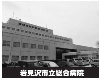
岩見沢市立総合病院