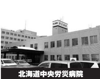
北海道中央労災病院

収容人員が多い一定規模以上の建物のうち、3年間継続して防火対策や地震等の防災対策が優良で、消防の認定を受けたものに掲げる事が出来ます。