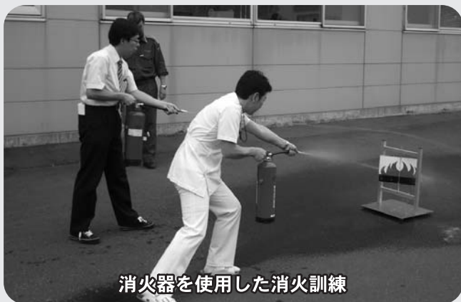
消火器を使用した消火訓練